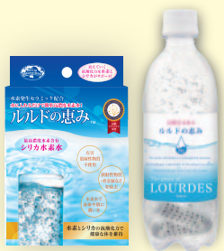
高濃度シリカ水素水 ルルドの恵み