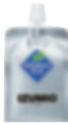
アルミパウチ タイプ (A社製)